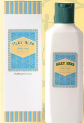
シルキーハーブボディソープ ■ 200mL ¥600 (税抜き) ■