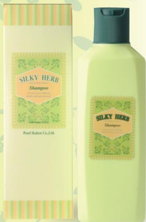
シルキーハーブ ヘアシャンプー