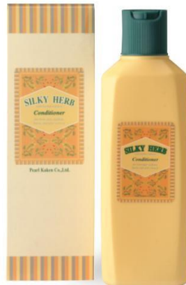
シルキーハーブヘアコンディショナー ■ 200mL ¥600 (税抜き) ■