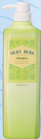
シルキーハーブヘアシャンプー ■ 1000mL ¥1,600 (税抜き) ■ クリーミーな泡立ちで髪をやさしく洗います。