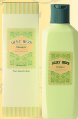
シルキーハーブヘアシャンプー ■ 200mL ¥600 (税抜き) ■