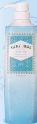
シルキーハーブボディソープ ■ 1000mL ¥1,600 (税抜き) ■ 洗った後はスッキリ、サラサラお肌にいやなヌメリ感が残りません。