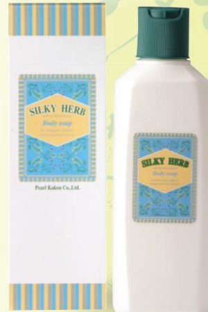
シルキーハーブ ボディソープ