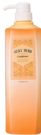
シルキーハーブヘアコンディショナー ■ 1000mL ¥1,600 (税抜き) ■ シャンプー後の髪に潤いを与え、ダメージから守ります。