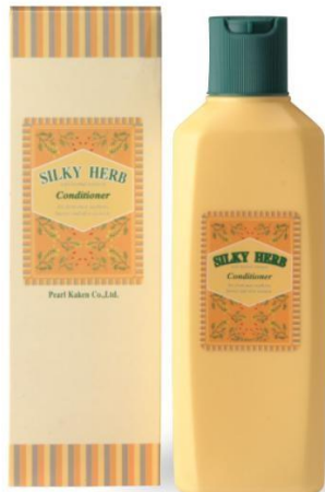
シルキーハーブ ヘアコンディショナー