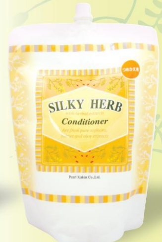
シルキーハーブヘアコンディショナー ■ 2000mL ■