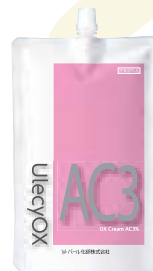
ウレシーオキシ AC3% 1000mL クリームタイプ 医薬部外品