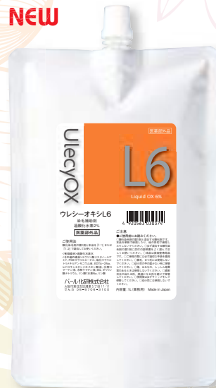
ウレシーオキシ L6% 1000mL リキッドタイプ 医薬部外品