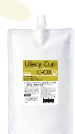
ウレシーカール C-OX 1000mL リキッドタイプ 医薬部外品