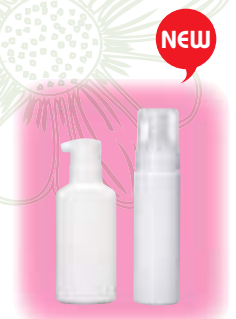
リキッドタイプ専用 ポンプフォーマー容器・ スクイズフォーマー容器は別売です。