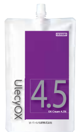
ウレシーオキシ 4.5% 1000mL クリームタイプ 医薬部外品