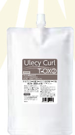
ウレシーカール T-OX 1000mL リキッドタイプ 医薬部外品