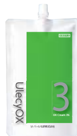
ウレシーオキシ 3% 1000mL クリームタイプ 医薬部外品