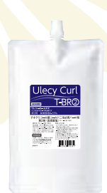
ウレシーカール T-BR 1000mL リキッドタイプ 医薬部外品