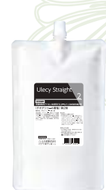
ウレシーストレート2 800g クリームタイプ 医薬部外品