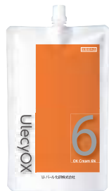
ウレシーオキシ 6% 1000mL クリームタイプ 医薬部外品