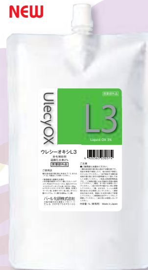
ウレシーオキシ L3% 1000mL リキッドタイプ 医薬部外品