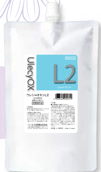
ウレシーオキシ L2% 1000mL リキッドタイプ 医薬部外品