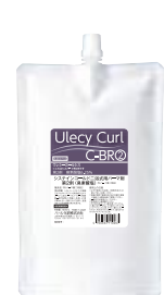
ウレシーカール C-BR 1000mL リキッドタイプ 医薬部外品