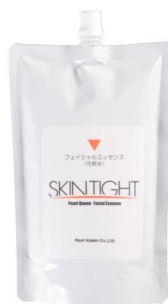
SKINTIGHT フェイシャルエッセンス 500mL(無香料)