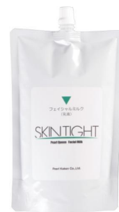
SKINTIGHT フェイシャルミルク 500mL