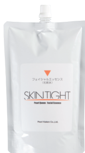
SKINTIGHT フェイシャルエッセンス 500mL(無香料)