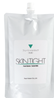
SKINTIGHT フェイシャルミルク 500mL